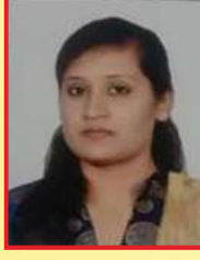
શ્રી રૈયોલીવાલા નઝરાના એ.